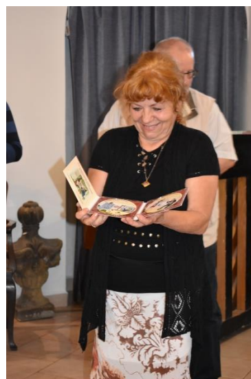
17. červenec 2022 – Křest audioknihy „Pohádky z malých Krkonoš“, konaný v rámci 27. ročníku hudebně-dramatického festivalu Lomnické kulturní léto