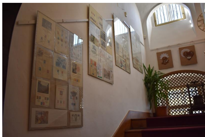
6. 3. – 24. 4. 2022 - „Letem světem s poštovními známkami“ první samostatná filatelická přehlídka v lomnickém muzeu