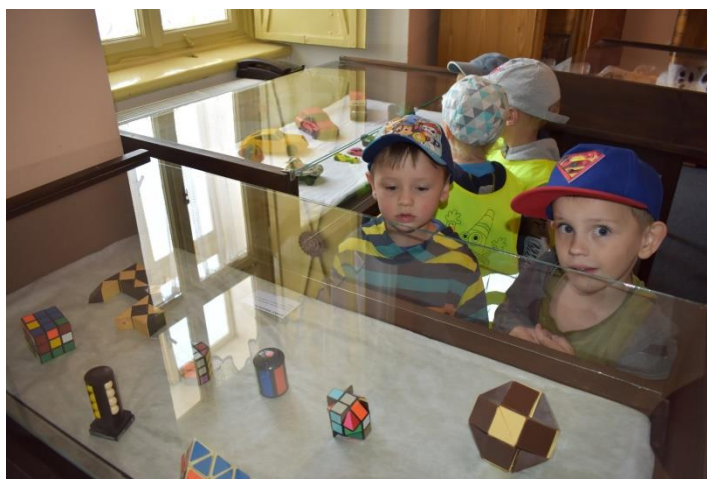
2. 6. – 9. 6. 2022 – „Naše dětství“

Fotografie ze společné krátkodobé výstavy s místní střední školou v rámci edukační činnosti, kterou doplnila firma Merkur (garant celé akce) o zápůjčku modelového kolejiště. To se stalo velkým lákadlem zejména pro nejmenší návštěvníky.